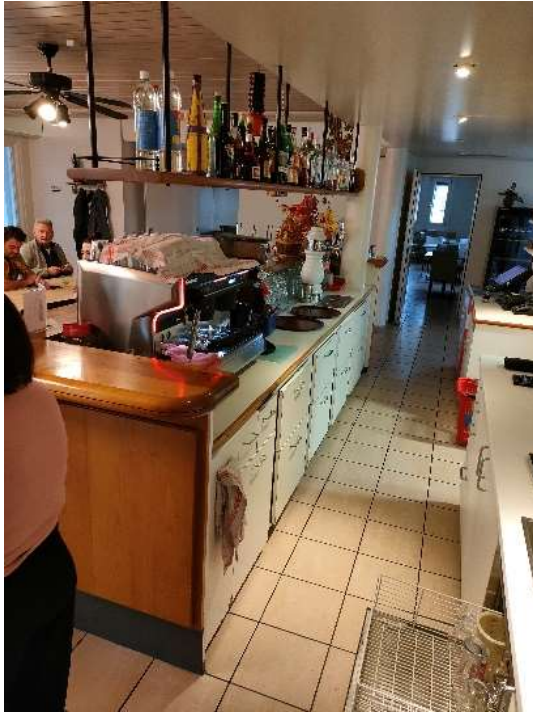
Buffet 13 m2