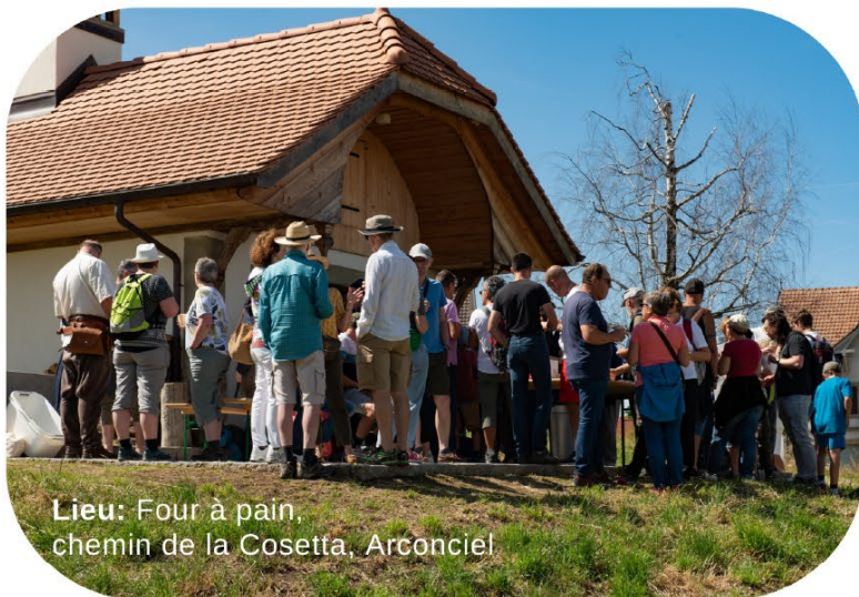
Lieu: Four à pain, chemin de la Cosetta, Arconciel